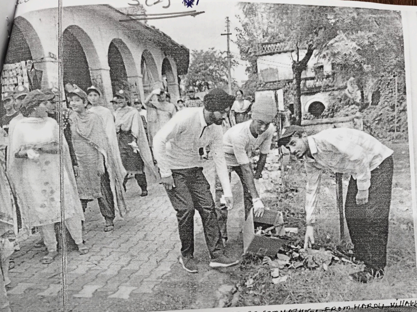
MERI MAAI, MERA DESH