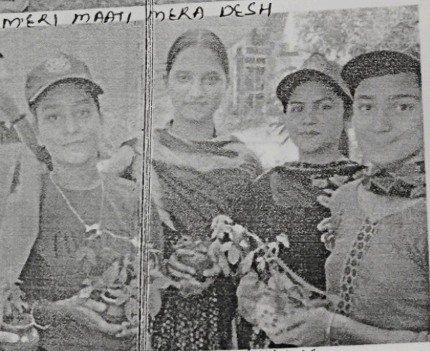
GARDENING & CLEANLINESS